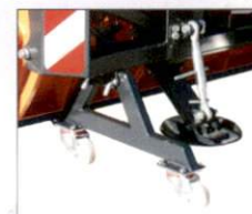
Abstellwagen zum einfachen Abstellen und Rangieren im abgehängenen Zustand