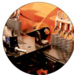
Drehpunkt für Schwenkung in Rahmenmitte