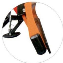
Aggressiver Anstellwinkel 25°