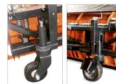
Laufräder (Vollgummi oder Luftbereift)